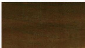
胡桃色 #13 (半透明)