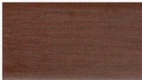
棕紅色 #15 (遮蓋色)