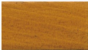
淺柚木色 #08 (半透明)