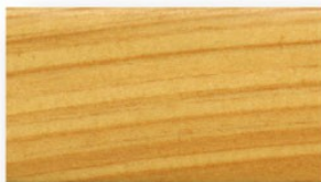
透明(本色) #06 (半透明)