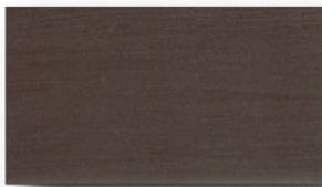
棕黑色 #18 (遮蓋色)