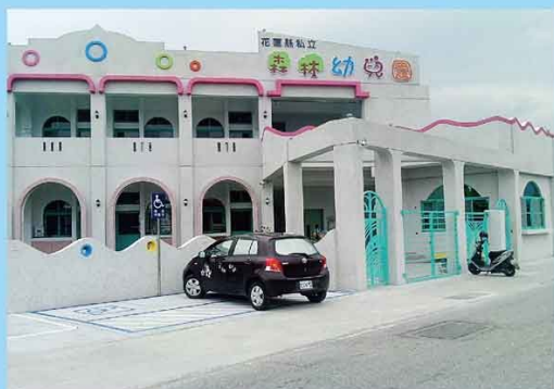
洗石子外牆石材保護劑