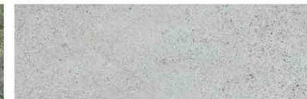
塗裝 O-888 (保持原狀)