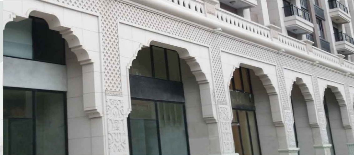
大樓石材外牆保護劑